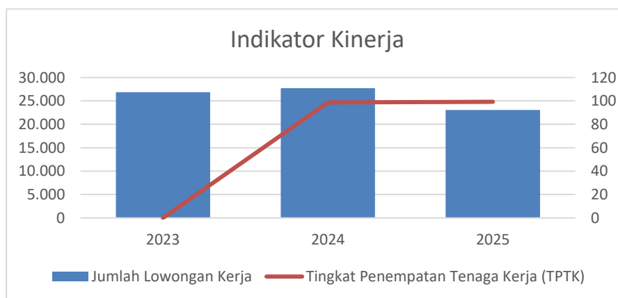
Gambar 3.1 Grafik Capaian Indikator Kinerja Tahun 2023-2025

Secara keseluruhan, perbandingan realisasi kinerja Tahun 2025 terhadap Tahun 2024 dan 2023 menunjukkan bahwa meskipun terdapat variasi pada beberapa indikator secara kuantitatif, kualitas capaian kinerja Tahun 2025 lebih optimal, tercermin dari tingginya persentase capaian terhadap target dan semakin kuatnya kontribusi terhadap tujuan pembangunan daerah. Hal ini menandakan adanya peningkatan efektivitas perencanaan, pelaksanaan program, serta penguatan kebijakan ketenagakerjaan secara berkelanjutan.